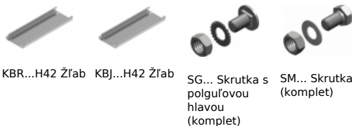
KBR...H42 Žľab KBJ...H42 Žľab SG... Skrutka s polguľovou hlavou (komplet) SM... Skrutka (komplet)