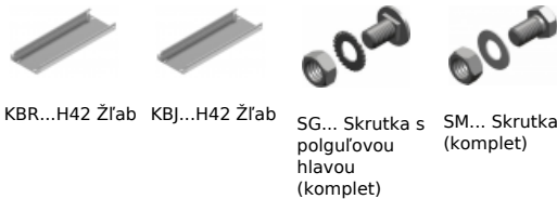
KBR...H42 Žľab KBJ...H42 Žľab SG... Skrutka s polguľovou hlavou (komplet) SM... Skrutka (komplet)