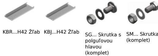
KBR...H42 Žľab KBJ...H42 Žľab SG... Skrutka s polguľovou hlavou (komplet) SM... Skrutka (komplet)